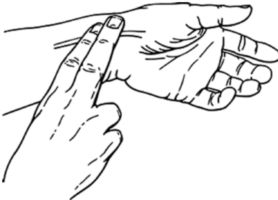
Figur 16.3 Hevet arm med trykkbandasje eller med hånden